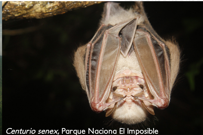
Centurio senex , Parque Nacional El Imposible