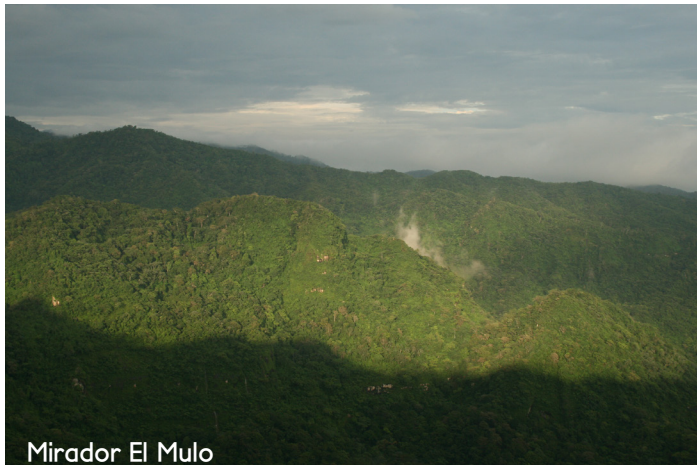
Mirador El Mulo