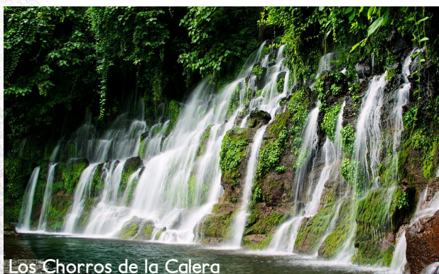
Los Chorros de la Calera

Para más información contacte: contacto@atves.org